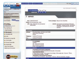
Le profil client renseigné

Un moyen facile d'accès à l'information que vous recherchez